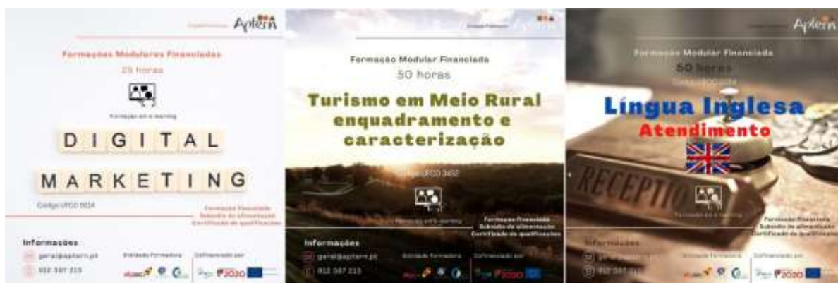
Figura 2. Cartazes das principais formações modulares lecionadas

Os projetos e formação modular financiada POISE-01-3524-FSE-003644 – Zona Norte e POISE-01-3524-FSE-003645 – Zona Centro, enquadrados na Tipologia de Operação 1.08 – Formação Modular para empregados e desempregados, iniciados em abril de 2021 com a parceria realizada com a ETP Sicó, têm sido desenvolvidos através de disciplinas que enfocam o Turismo em Espaço Rural, a Língua Inglesa e o Marketing Digital. As temáticas são escolhidas numa lógica de dar resposta à procura demonstrada pelos associados individuais da APTERN. Estas formações têm demonstrado ser uma mais valia também para empresários que desenvolvem a sua atividade em turismo em espaço rural ou para pessoas que pretendem iniciar o seu negócio no setor.