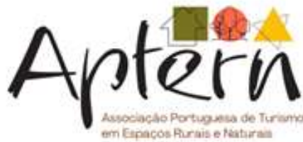
Figura 1. Logotipo da APTERN

A alteração da identidade visual da associação, que passou pela alteração do logotipo (mantendo-se o letring e alterando-se a imagem associada) foi um compromisso assumido pela nova direção, com o intuito de melhor comunicar as principais áreas de atuação da associação: os alojamentos localizados em espaços rurais e naturais, a natureza envolvente, e a animação turística que se pode desenvolver nesses territórios.